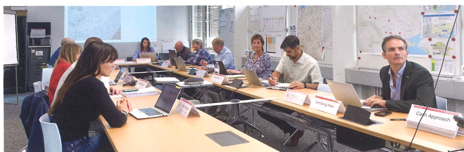
Fig. 3: Les cartes produites par les spécialistes en SIG sont toujours utilisées au sein des cellules de crise de l'Aide humanitaire à Berne.

Mary Brown Ozgür Unal Département fédéral des affaires étrangères DFAE Direction du développement et de la coopération DDC Aide humanitaire Effingerstrasse 27 CH-3003 Bern mary.brown@eda.admin.ch ozguer.unal@eda.admin.ch