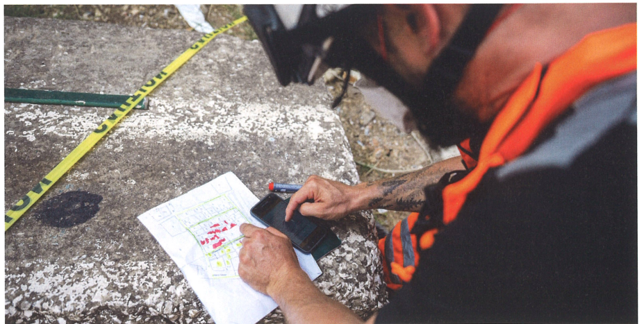
Fig. 1: Après l'explosion au port de Beyrouth en août 2020, les experts suisses ont utilisé une application mobile SIG (Survey123) pour l'évaluation des dégâts.

Les services SIG peuvent s'avérer très utiles pour les autorités des pays confrontés à une situation de crise. En été 2019, alors que des millions d'hectares de forêts brulaient dans l'est de la Bolivie, une